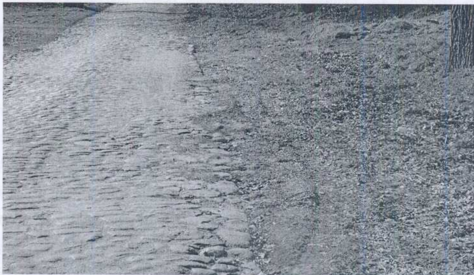
Zdjęcie nr 4 Droga dojazdowa do terenu inwestycji.

Inwestycja zlokalizowana będzie na działkach nr 137/17, 70, 137/29 obręb Osowo Lęborskie. Chodnik pozwoli na bezpieczne dotarcie do powstałego kompleksu wszystkim osobom bez względu na wiek i sprawność fizyczną. Chodnik zlokalizowany będzie wzdłuż drogi gminnej o nawierzchni brukowanej łączącej z drogą wojewódzką nr 214 wszystkie zabudowania zlokalizowane wzdłuż drogi i wiedzie do miejsca, w którym ma powstać przyszły kompleks rekreacyjno-sportowy. W celu zapewnienia dobrego odpływu wód opadowych stanowiących problem w czasie niepogody zamontowany zostanie system odprowadzania wód.