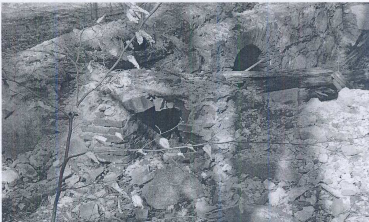
Zdjęcie nr 3 Ruiny byłego magazynu warzywnego.

Nieopodal gruzowiska podworskiego, w pobliskim lesie znajdują się ruiny po budynku, który w czasach pegeerowskich został zaadaptowany jako magazyn warzywny (zdjęcie nr 3). Oglądając pozostałości murów można jedynie domniemywać o dawnej jakości budowli dworskich i majątkowych. Pozostałe dziś szczątki murów i budowli są kolejnym elementem oszpecającym teren i wymagającym natychmiastowej interwencji.