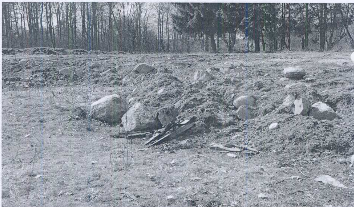
Zdjęcie nr 2 Gruzowisko po budynku byłego pałacu dworskiego.

Pozostałość budynku pięknego dworu mieszczącego się na terenie realizacji projektu ze względów bezpieczeństwa należało wyburzyć. Ruiny stwarzały bowiem ogromne zagrożenie dla bawiących się tam dzieci. Stąd też w miejscu, gdzie niegdyś stał okazały budynek dworski, dziś znajduje się jedynie sarta gruzu oszpecająca teren. Taki stan rzeczy zobrazowany na zdjęciu nr 2, obniża estetykę obszaru i wymaga natychmiastowej interwencji.