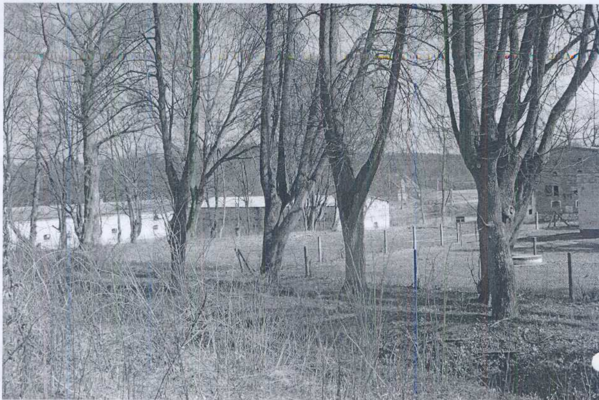
Zdjęcie nr 1 Pozostałość alejki w dawnym parku przydworskim.

Pozostałość budynku pięknego dworu mieszczącego się na terenie realizacji projektu ze względów bezpieczeństwa należało wyburzyć. Ruiny stwarzały bowiem ogromne zagrożenie dla bawiących się tam dzieci. Stąd też w miejscu, gdzie niegdyś stał okazały budynek dworski, dziś znajduje się jedynie sarta gruzu oszpecająca teren. Taki stan rzeczy zobrazowany na zdjęciu nr 2, obniża estetykę obszaru i wymaga natychmiastowej interwencji.