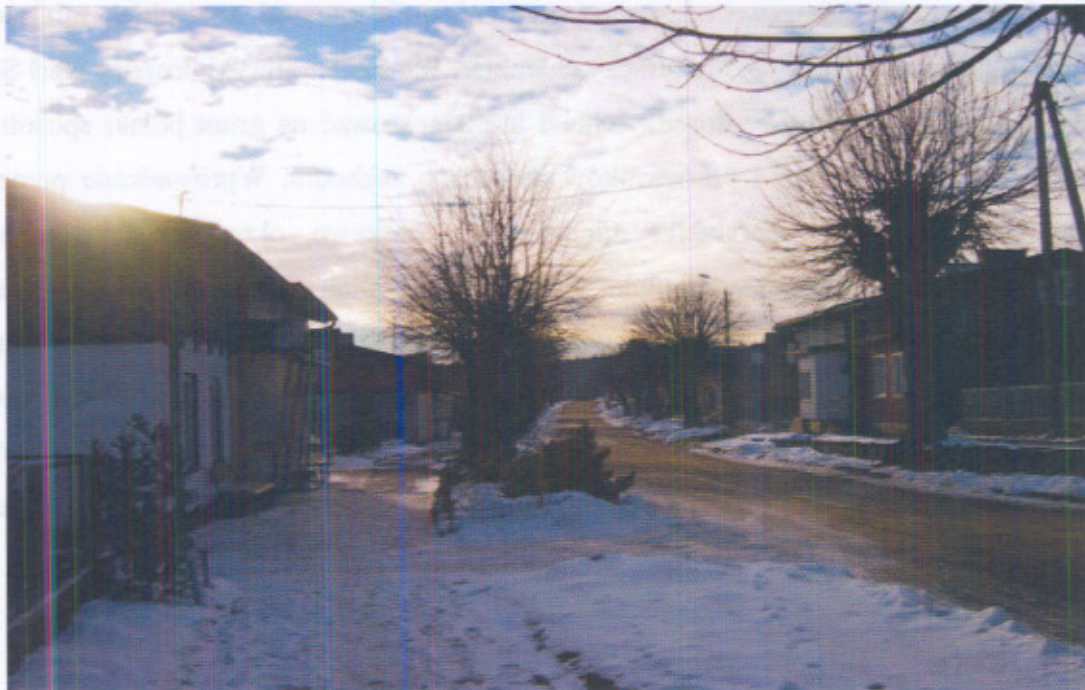
Ulica Drewniana w Maszewie stan obecny.

Niedaleko tego miejsca został wybudowany kompleks domów murowanych przeznaczonych dla kadry typowo kierowniczej pracującej w Fabryce. Domy te cechował wyższy standard wykonania.