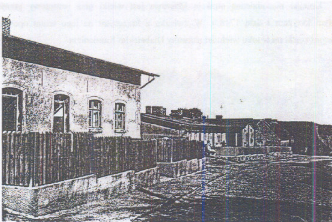
Ulica Murowana w Maszewie w 1925 r. Widok od strony północnej.

Dzisiaj ulice te uznawane są za jedną z głównych atrakcji miejscowości oferowaną przyjezdnym i turystom. W czasach obecnych niestety odbiegają one swym wyglądem od stanu pożądanego i teoretycznie w przyszłości wymagałyby przeprowadzenia gruntownej modernizacji uwzględniającej charakter ulic. Mimo swej atrakcyjności i niecodzienności ulic nie udało się wpisać do ewidencji zabytków Województwa Pomorskiego.