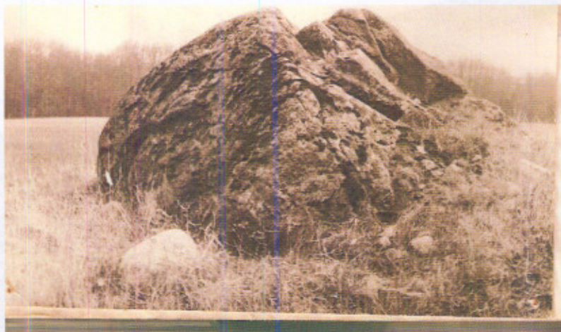
Diabelski Kamień w Maszewie.

Kolejną niecodzienną atrakcją Maszewa jest wielki głaz narzutowy graniczny z wyrytym krzyżem i datą 1748 r. W związku z krążącymi na jego temat opowieściami ludowymi został on w toku wielu lat nazwany Diabelskim Kamieniem.