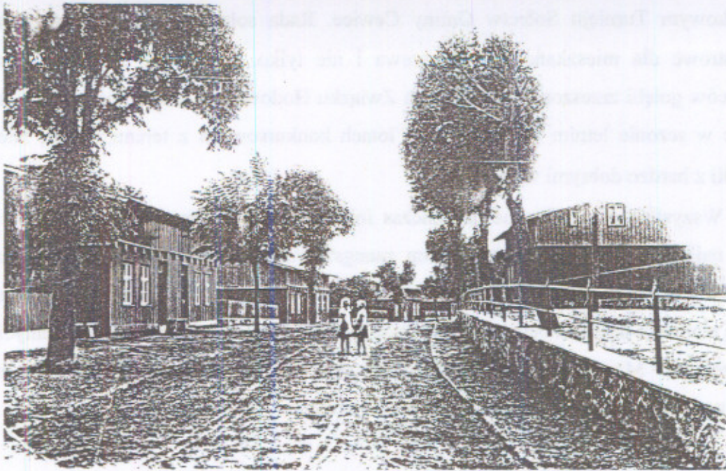
Ulica Drewniana w Maszewie w 1915 roku. Widok od strony wschodniej.