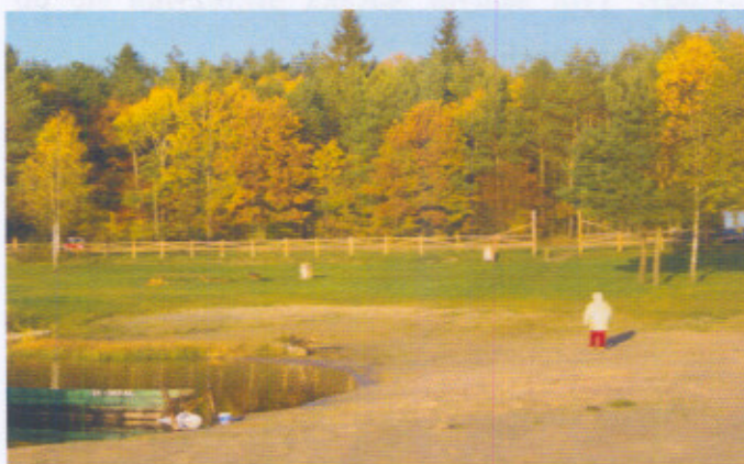
Plaża nad Jeziorem Brody jesienią.

najslabsze gleby V i VI klasy bonitacji. W miejscach nieco żyzniejszych występują fragmenty dobrze zachowanych grądów, łągów i buczyn. Są to zazwyczaj stare drzewostany, cenne pod względem botanicznym. Wśród lasów napotyka się na enklawy zbiorowisk torfowych lub potorfia z silnie zaznaczoną sukcesją w kierunku zbiorowisk leśnych. Wokół części zamieszkałej roztaczają się mokre łąki intensywnie wypasane w okresie od wiosny do jesieni. Klimat charakteryzuje się dużą zmiennością. Zimy są długie, śnieżne i mroźne, lata wilgotne. Sołectwo Maszewo cechuje niezmiernie bogactwo zjawisk i obiektów przyrodniczych wyróżniających je spośród wszystkich sołectw gminnych i stanowiących o atrakcyjności turystycznej Maszewa. Wspomnieć tu przede wszystkim należy o niezwykle malowniczym jeziorze Brody, znajdującym się w odległości około 3 km od miejscowości Maszewo. W latach ubiegłych władze gminy we współpracy z Nadleśnictwem Cewice zorganizowały tu teren rekreacyjno-wypoczynkowy dla mieszkańców Gminy Cewice. Wydzielono obszar z miejscem do grillowania, plażą wzdłuż linii jeziora. W celach informacyjnych zamieszczono tablice edukacyjno-informacyjne, ustawiono kosze na śmieci, ławeczki itp. Zmodernizowano także drogę dojazdową i przygotowano miejsca postojowe dla pojazdów osobowych. Po dziś dzień teren ten oblegany jest w okresie letnim przez kąpielowiczów z terenu gminy i przyjezdnych. Niezwykle piękno tego obszaru przemawia za organizowaniem tu wielu festynów i imprez okolicznościowych.