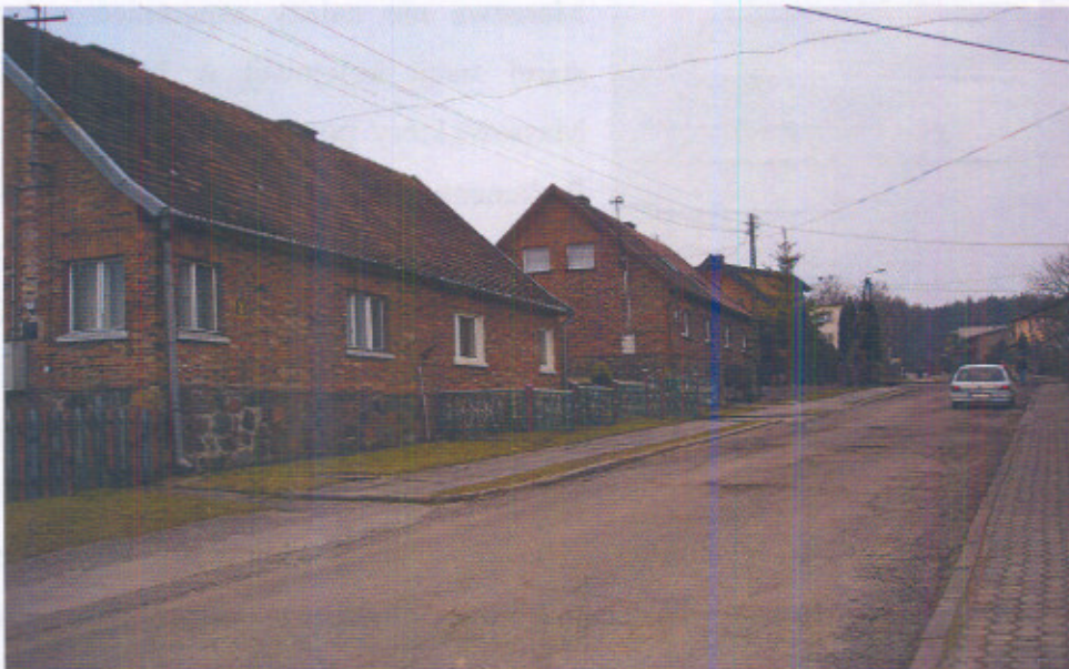
Maszewo ul. Murowana stan obecny

Dzisiaj ulice te uznawane są za jedną z głównych atrakcji miejscowości oferowaną przyjezdnym i turystom. W czasach obecnych niestety odbiegają one swym wyglądem od stanu pożądanego i teoretycznie w przyszłości wymagałyby przeprowadzenia gruntownej modernizacji uwzględniającej charakter ulic. Mimo swej atrakcyjności i niecodzienności ulic nie udało się wpisać do ewidencji zabytków Województwa Pomorskiego.