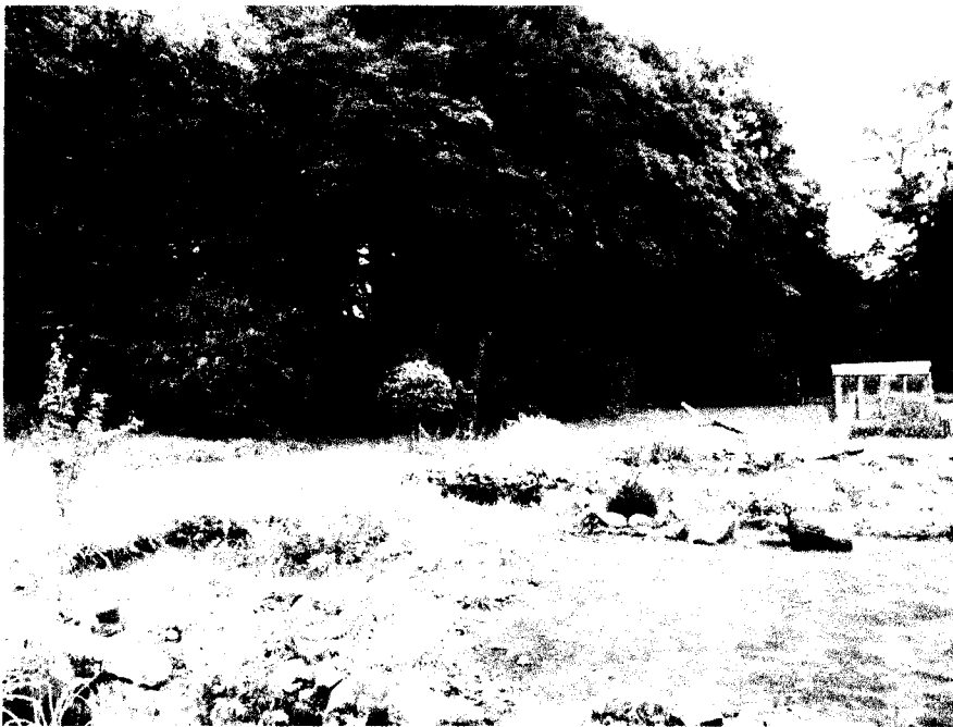
W miejscowości Okalice zachowały się fundamenty dworku z dziedzińcem i parkiem