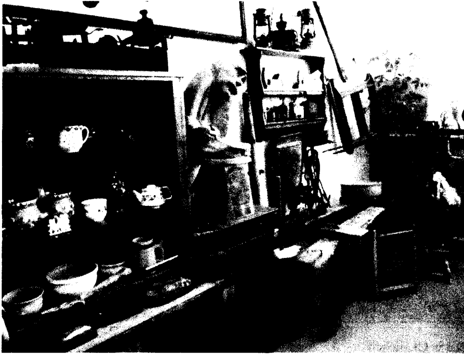
Izba regionalna im. Remusa w Niepublicznej Szkole Podstawowej w Popowie