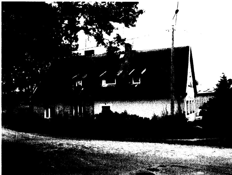
W wiosce istnieje kilka domów stuletnich, m. in. „dawna szkoła”.