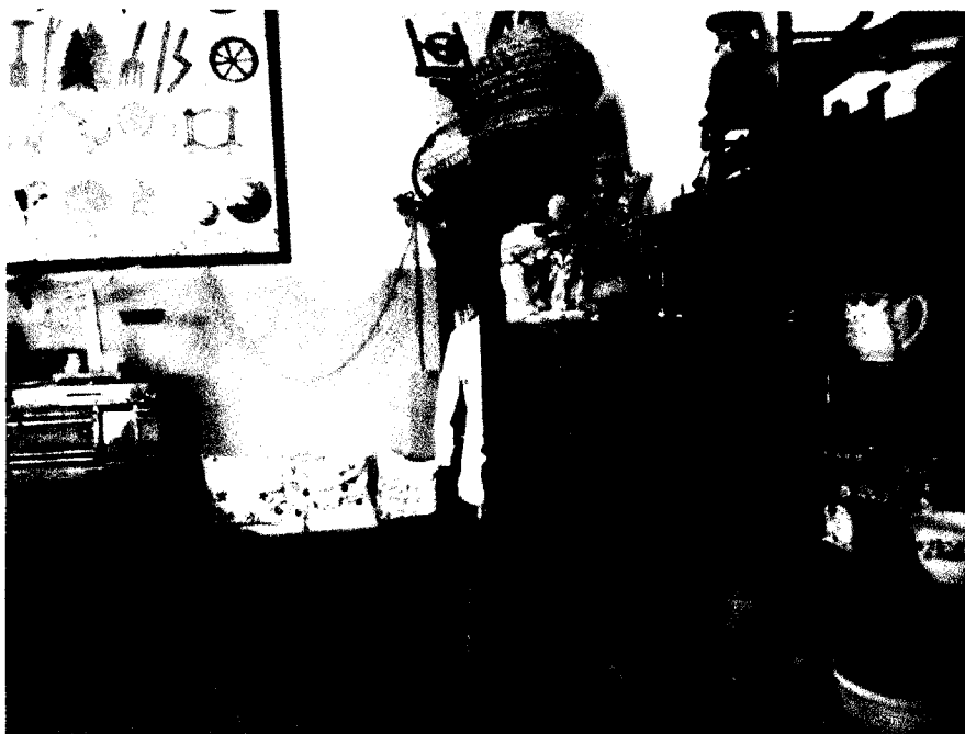
Izba regionalna im. Remusa w Niepublicznej Szkole Podstawowej w Popowie