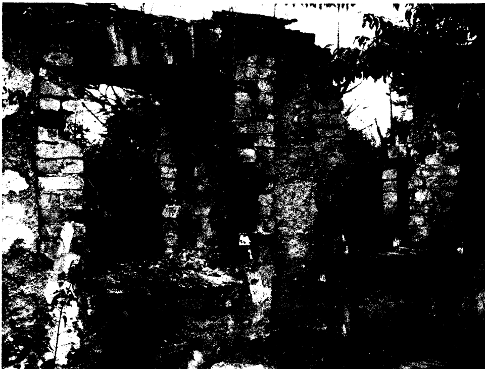
Pozostałe fragmenty budynku gospodarczego