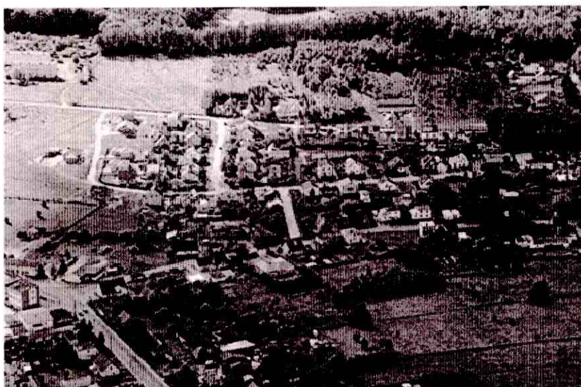
Zdjęcie Osiedla Młodych z lotu ptaka

Odzwierciedleniem trendów lat 90 XX wieku oraz pierwszego dziesięciolecia XXI wieku są domy jednorodzinne, zamieszkałe przede wszystkim przez ludność napływową. Powstają też „stylizowane” na starą zabudowę budynki ze sklepami, pizzeriami, itp. Architektura powstających budowli wprowadza do wyglądu miejscowości różnorodność odzwierciedlająca aktualne trendy budownictwa. Powstają budynki jedno- i dwukondygnacyjne z poddaszem użytkowym, domy dwukondygnacyjne z parterem zaadaptowanym do pełnienia funkcji handlowych, wreszcie parterowe domy przeznaczone tylko na działalność usługową. Całości architektonicznej miejscowości dopełniają budowle albo bardzo nowoczesne pod względem formy zabudowy w stylu wspomnianego już Publicznego Gimnazjum, albo zabytki architektury zaadaptowane do pełnienia funkcji publicznych, jak Dworek ze SP w Cewicach i Publicznym Gimnazjum lub Stary Spichlerz z siedzibą Gminnego Centrum Kultury. Reasumując stwierdzić należy, iż obecnie wśród tak dużej różnorodności architektury miejscowości, mimo wszystko charakter jej kształtuje przede wszystkim bardzo estetyczna pod względem formy zabudowa jednorodzinna. Rozwój osiedli domków jednorodzinnych skoncentrowany jest głównie przy ulicy Spacerowej, Myśliwskiej, Kwiatowej, Bursztynowej oraz na Osiedlu Młodych. W związku z szybkim zasiedlaniem tych terenów konieczne jest zapewnienie bezpiecznej i komfortowej komunikacji osobom zamieszkałym przy tych ulicach.