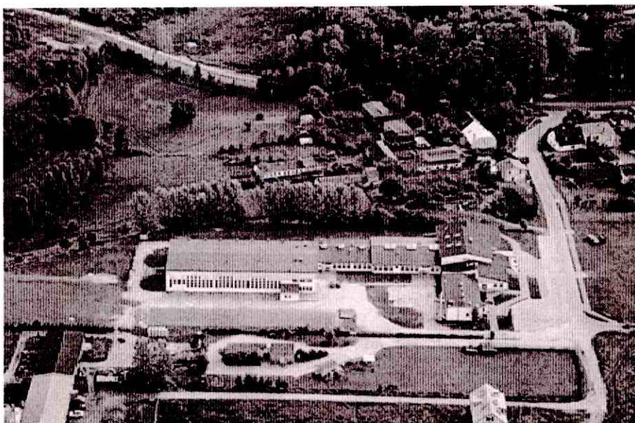
Zdjęcie Publicznego Gimnazjum w Cewicach z lotu ptaka.

W pierwszych latach XXI wieku w związku z reformą szkolnictwa rozbudowano budynek Publicznego Gimnazjum wprowadzając do architektury miejscowości formę bardzo nowoczesną, opartą o zabudowę parterową.