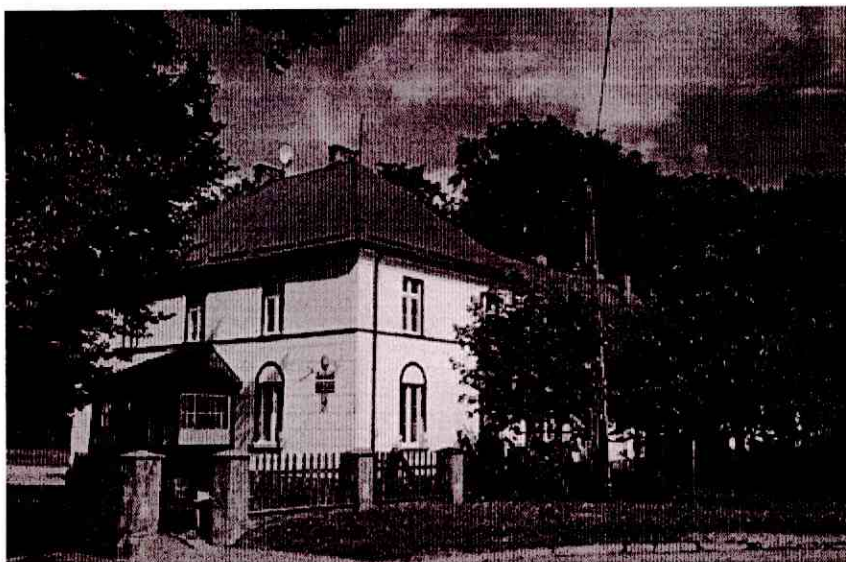
Zdjęcie Dworku w Cewicach