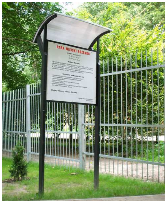
Zdjęcie nr 2. Tablica informacyjna.