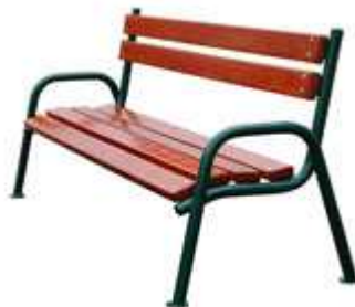
Rysunek nr 8. Ławka z oparciem