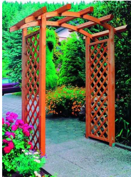
Zdjęcie nr 1. Pergola