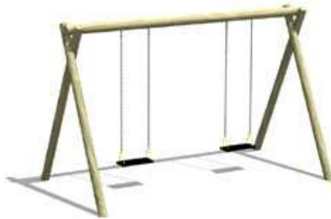
Rysunek nr 3. Huśtawka podwójna łańcuchowa