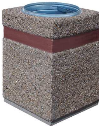
Rysunek nr 10. Kosz na śmieci