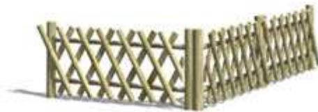
Rysunek nr 7. Płot drewniany tzw. myśliwski diagonalny