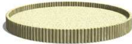
Rysunek nr 6. Piaskownica