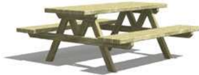
Rysunek nr 9. Ławko – stół