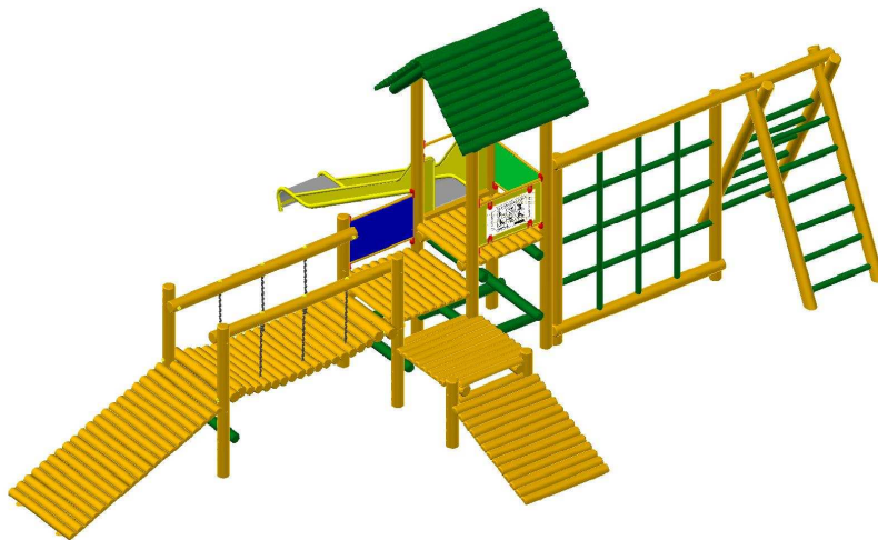
Rysunek nr 1. Zestaw zabawowy składający się z wieży z dachem dwuspadowym, trapezschodków, przeplotni, pomostu wiszącego, zjeżdźalni i drabinki krzyżakowej.