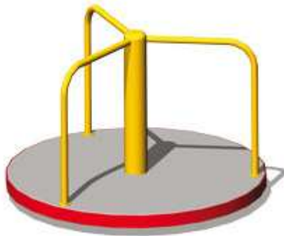
Rysunek nr 4. Karuzela tarczowa