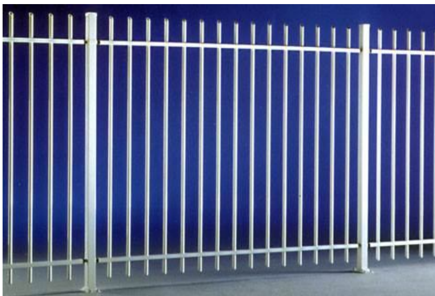
Fot. Przykład ogrodzenia palisadowego.

- Miejsce rekreacyjne z ławkami znajdujące się bezpośrednio przy stawie oraz ogrodzenie punktu widokowego należy zabezpieczyć ogrodzeniem drewnianym, zabezpieczonym przed czynnikami atmosferycznymi i biologicznymi zgodnie z normami.