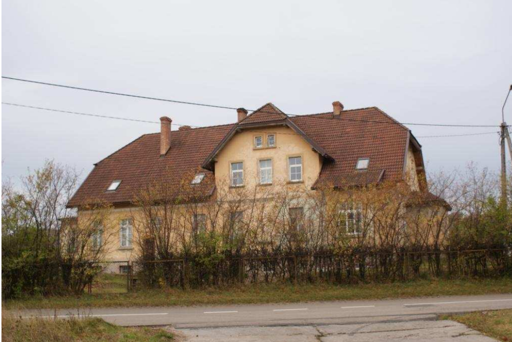
Zdjęcie nr 3. Dwór w Oskowie.

Na terenie wsi znajduje się także cmentarz poniemiecki, który wymaga uporządkowania.