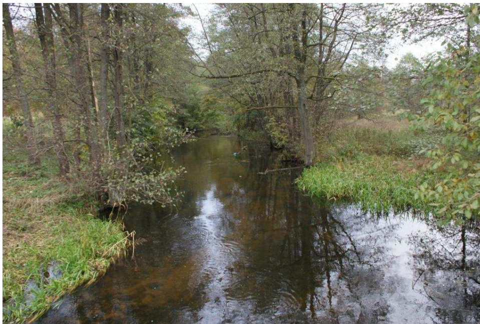
Zdjęcie nr 2. Rzeką Bukowina

roślinnego i zwierzęcego znalazło odzwierciedlenie w ustanowieniu obszaru Natura 2000 „Dolina Łupawy”. Rzeką Bukowina wpływa do położonego w odległości 1 km od wsi jeziora o powierzchni ponad 12 ha. Przy brzegu jeziora znajduje się przystań dla łódek oraz miejsce do biwakowania. W sezonie letnim na rzece organizowane są spływy kajakowe. Jezioro jest również ulubionym miejscem letniego wypoczynku nie tylko mieszkańców Oskowa, ale też innych miejscowości gminnych, a nawet gości spoza gminy Cewice. Jezioro wymaga jednak zagospodarowania linii brzegowej i uporządkowania plaży. W Oskowie są również idealne warunki dla miłośników wędkowania, ponieważ rzeka i jezioro obfitują w liczne gatunki ryb. W okolicach wsi znajdują się także dwa mniejsze jeziora.