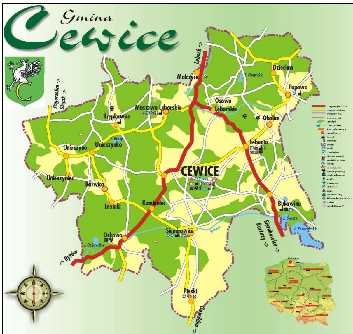
Rysunek nr 1. Mapa Gminy Cewice

Wieś Oskowo położona jest w północnej części województwa pomorskiego, w południowej części powiatu lęborskiego, w południowo-zachodniej części gminy Cewice, która graniczy z sześcioma gminami: Nowa Wieś Lęborska, Potęgowo, Czarna Dąbrówka, Sierakowice, Linia i Łęczyce.