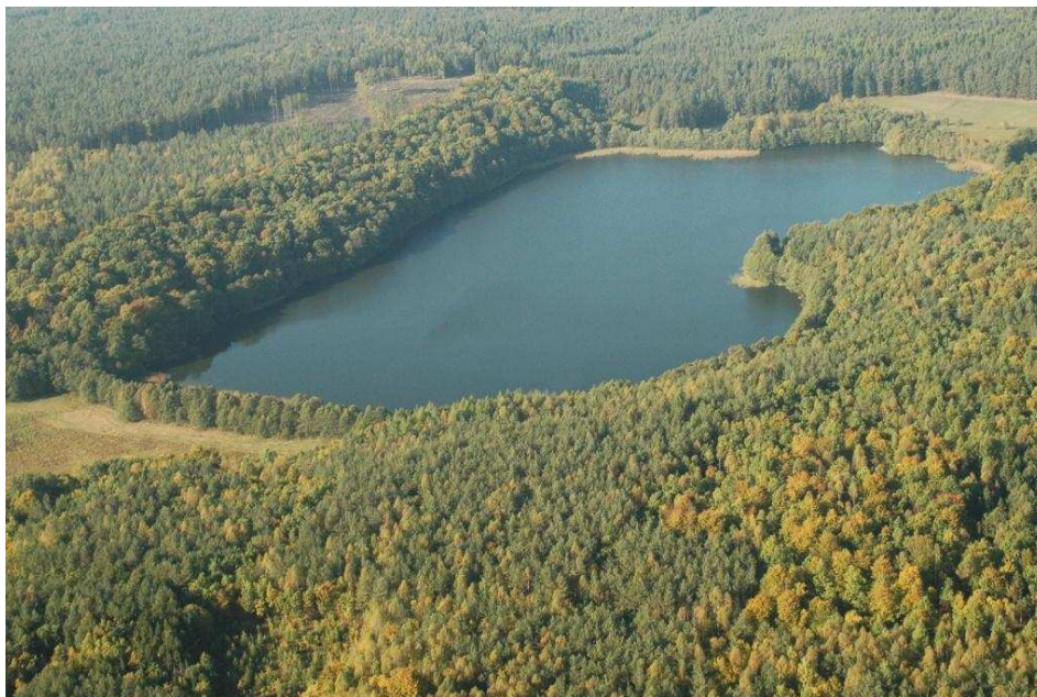
Zdjęcie nr 1. Jezioro w Oskowie

Oskowo położone jest w granicach Wysoczyzny Polanowskiej.